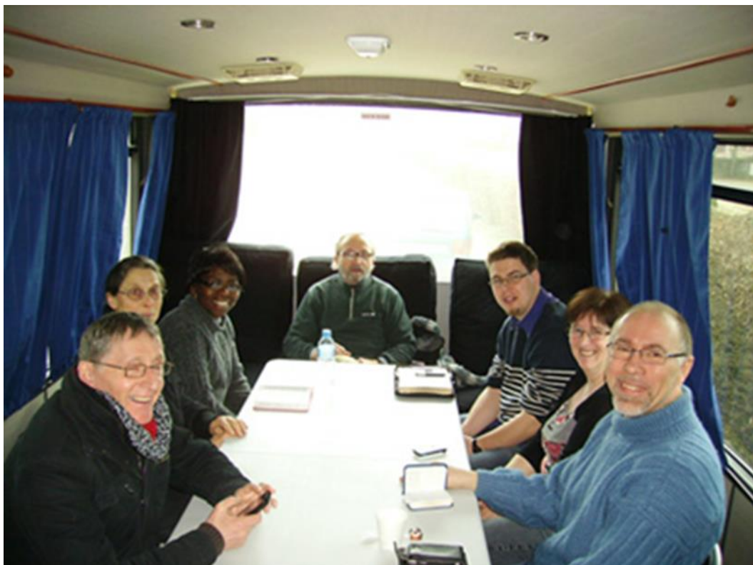
Espace polyvalent (couchage la nuit et réunions le jour)