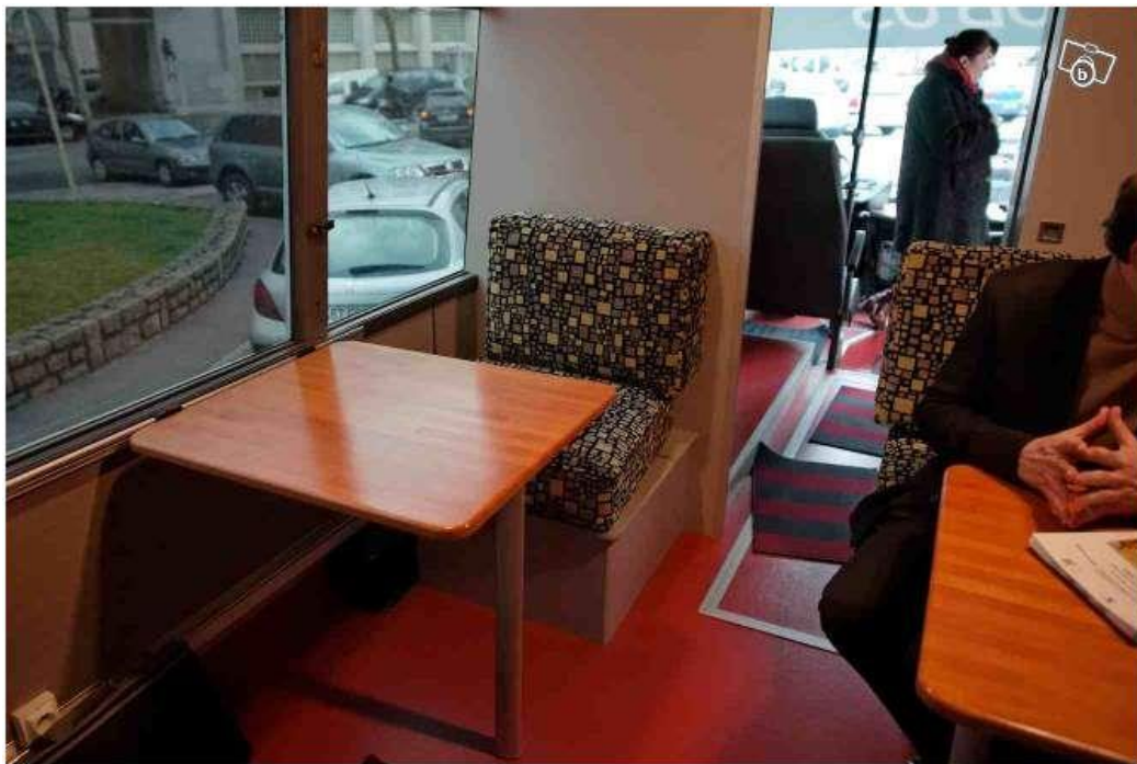
Espace pour des entretiens