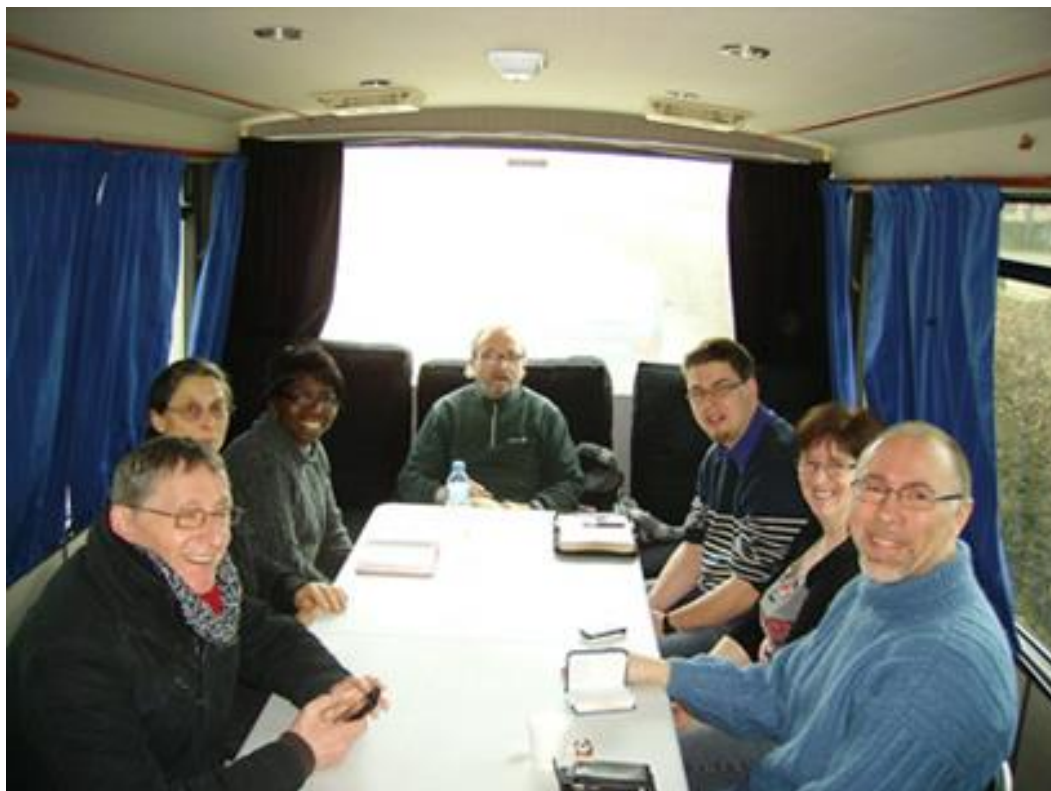
Espace polyvalent (couchage la nuit et réunions le jour)