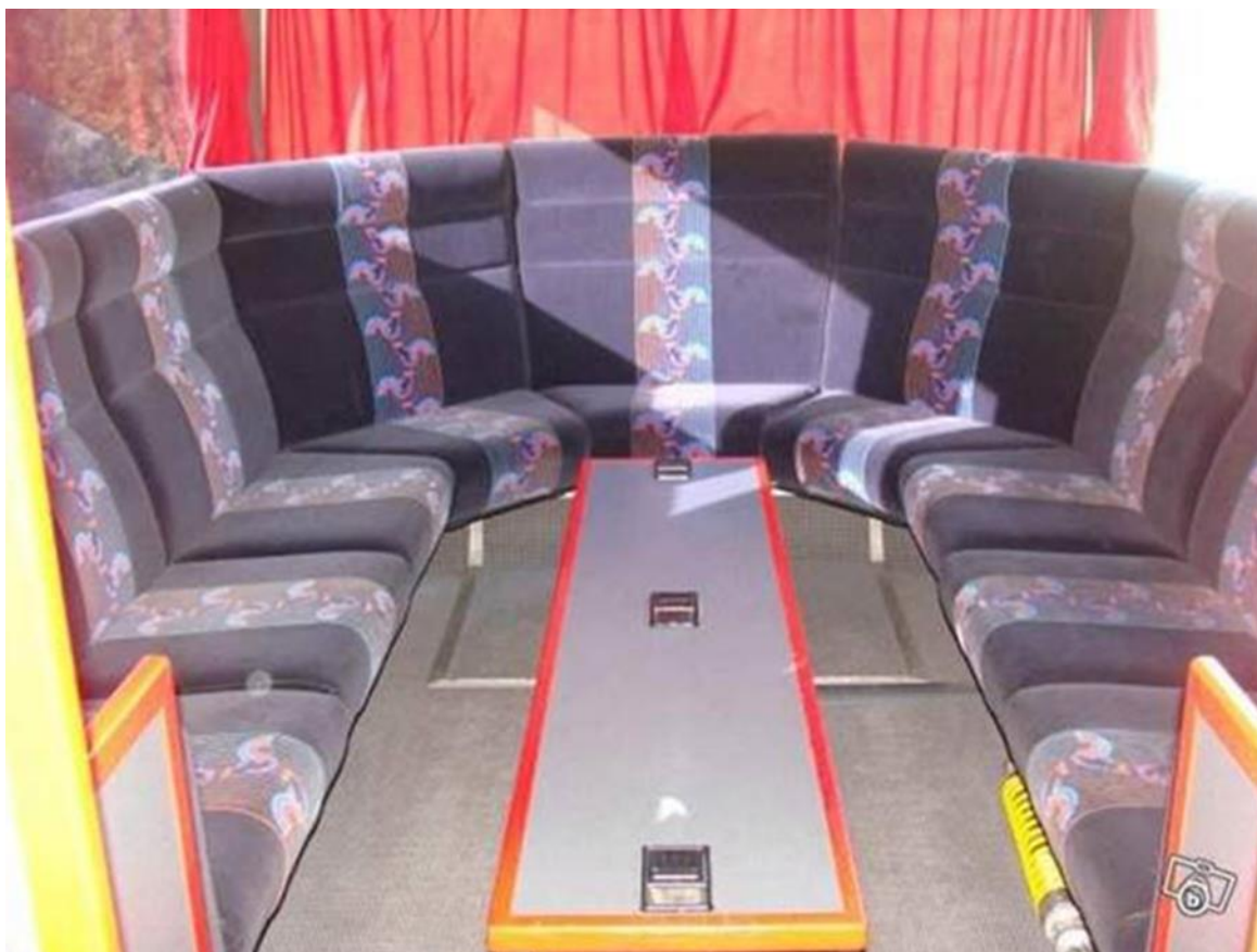
Espace polyvalent (réunions, repas, coffee-bar)