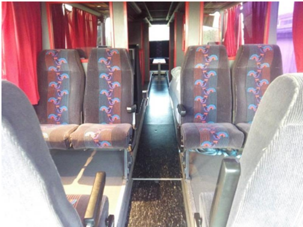
Espace pour des entretiens